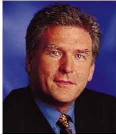
Dr. Michael Vesper Minister für Bauen und Wohnen des Landes Nordrhein-Westfalen